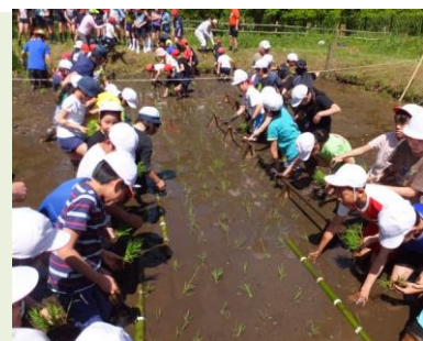
小学校児童の田植え体験

【お問い合わせ先】NPO 下田の杜里山フォーラム;事務局 廣沢 TEL 04-7139-6322